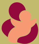
Nadace Terezy Maxové